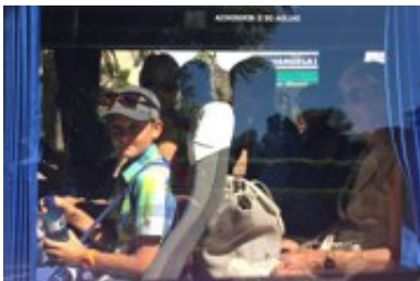
Vom Flughafen Barcelona direkt ins PEP und umgekehrt.