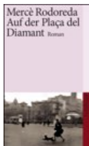
Mercè Rodoreda: Auf der Plaça del Diamant