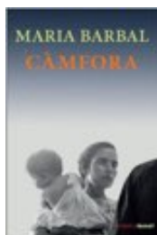
Maria Barbal: Càmfora